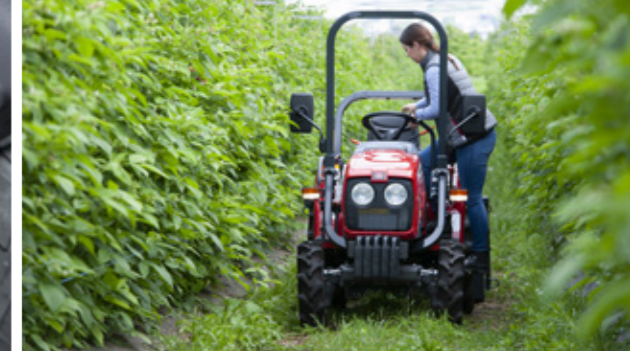
FACILIDAD DE ACCESO desde ambos lados con el ROPS trasero plegable