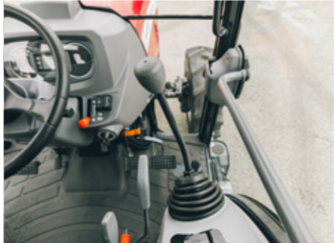
Mayor confort gracias a la columna de dirección inclinable y al joystick hidráulico de lado derecho, que permite un control fácil y preciso de los aperos