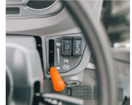
Controles prácticos para ajustar y activar el régimen del motor