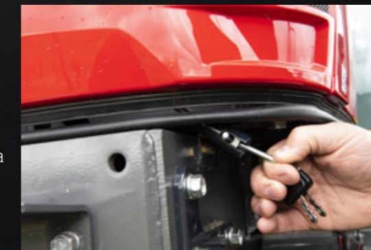
Fácil apertura del capó.

Toda nuestra gama ha superado un minucioso examen por parte de nuestros ingenieros desde todos los puntos de vista (compatibilidad óptima con su equipo, seguridad, durabilidad y rendimiento). Su concesionario Massey Ferguson cuenta con todas las herramientas de instalación y los conocimientos necesarios para proporcionarle un servicio de alto nivel.