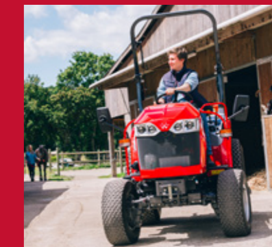
NEUMÁTICOS DE CÉSPED