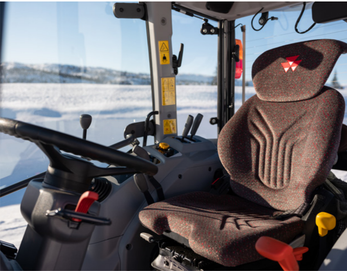
ESPACIO DE TRABAJO CONFORTABLE PARA ALIGERAR LA JORNADA Disponible asiento con suspensión neumática opcional