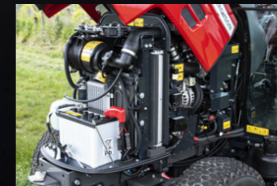
El diseño del eje delantero y el capó estilizado garantiza un acceso cómodo a los filtros de aceite del motor.