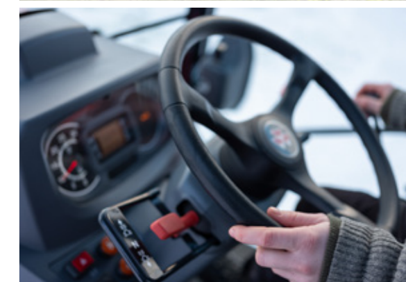
Transmisión mecánica con Power Shuttle en el modelo MF 1700 M - 12 velocidades de avance y 12 de retroceso para gozar del máximo confort en cada aplicación.