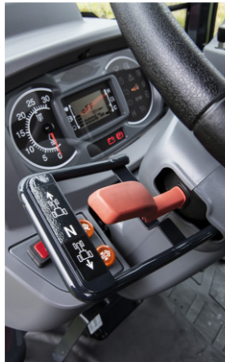
Palanca electrohidráulica del inversor en los modelos MF 1700 M para un mayor confort