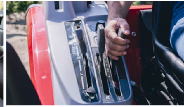
Facilidad de acceso a los ajustes del elevador y el sistema hidráulico