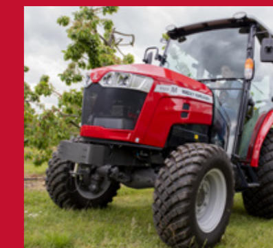
NEUMÁTICOS DE SERVICIO MIXTO