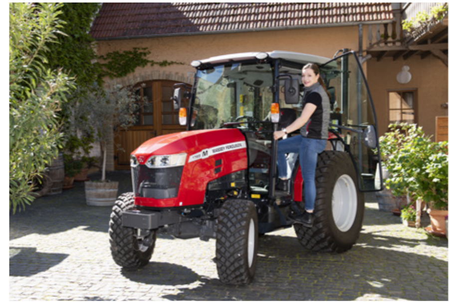
Acceso fácil y seguro por ambos lados con la ayuda de dos empuñaduras y un estribo