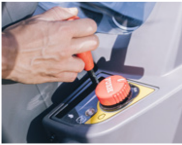
Palanca del acelerador de mano bien posicionada