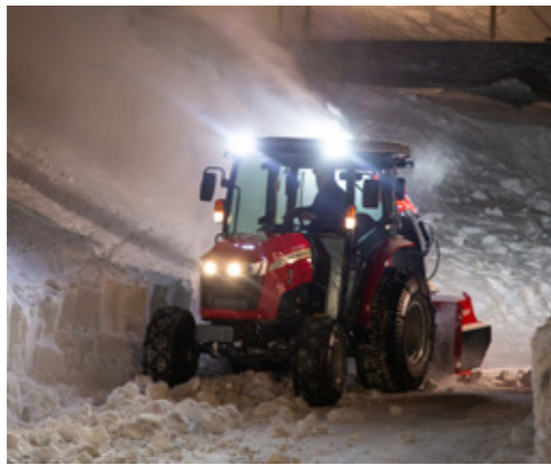
4 LUCES DE TRABAJO LED, dos delante y dos detrás

A VECES, LOS PEQUEÑOS DETALLES PUEDEN REPRESENTAR UN CAMBIO ABISMAL EN SU CARGA DE TRABAJO.