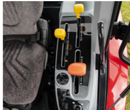
Las palancas codificadas por colores facilitan y agilizan las operaciones