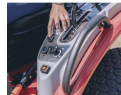
Facilidad de manejo con el control de crucero

El MF 1525 usa un control de doble pedal, uno para cada sentido de la marcha, lo que permite una conducción sin embrague para un mayor confort.