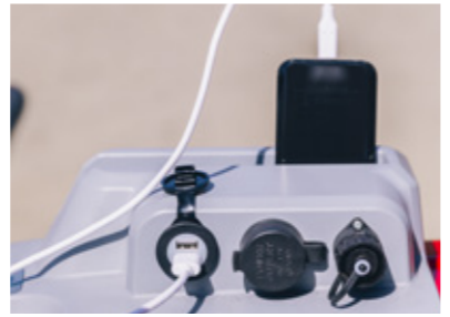
SOPORTE DEL TELÉFONO con 2 puertos USB y toma de 12 V